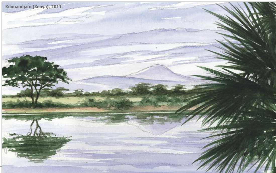
Kilimandjaro (Kenya), 2011.