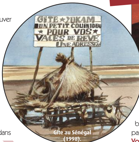
Gîte au Sénégal (1998).

Non, pas de Bruce Willis pour sauver le monde... Le soir, le groupe avait rendez-vous sur une dune célèbre pour son coucher de soleil spectaculaire. Mais nous avions tous en tête, en surimpression, les images des tours s'effondrant. Personne ne disait mot. Le lendemain, la plupart des gens qu'on croisait étaient horrifiés, mais les positions anti-américaines apparaissaient, justifiant l'attentat par le comportement des Américains dans