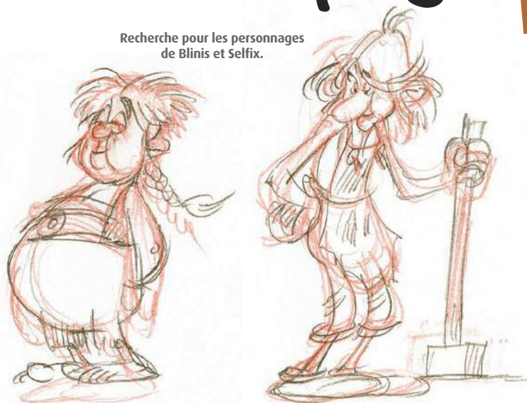
Recherche pour les personnages de Blinis et Selfix.

Chaque jour, de 100 000 m 2 de stockage un peu partout en France, partent près de 20 000 colis