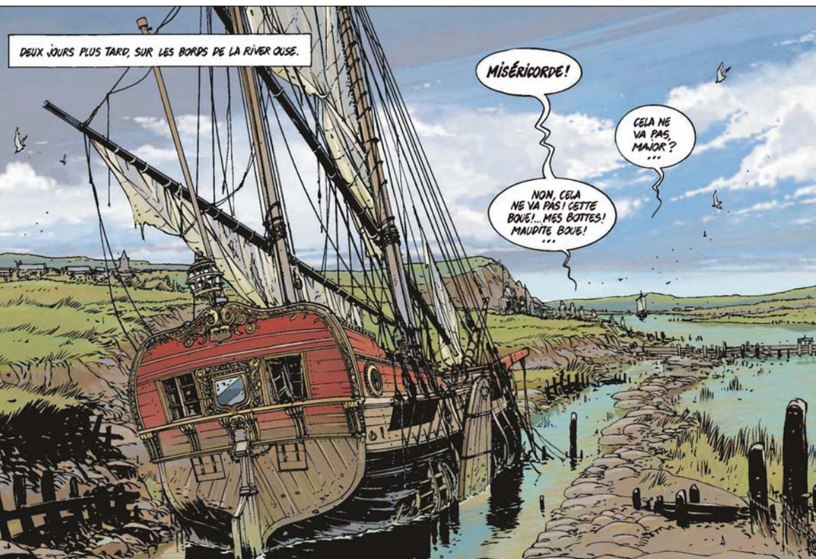
DEUX JOURS PLUS TARD, SUR LES BORDS DE LA RIVER OUSE.